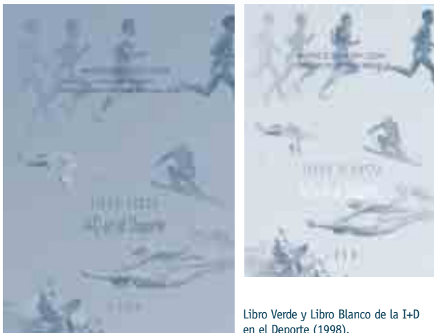
Libro Verde y Libro Blanco de la I+D en el Deporte (1998).

No cabe duda de que el avance que han experimentado muchos productos y servicios socio-sanitarios de carácter técnico durante la segunda mitad del siglo XX no habría sido posible sin la aportación concurrente de nuevas y avanzadas tecnologías que han permitido el desarrollo de soluciones a problemas relacionados con las discapacidades. >