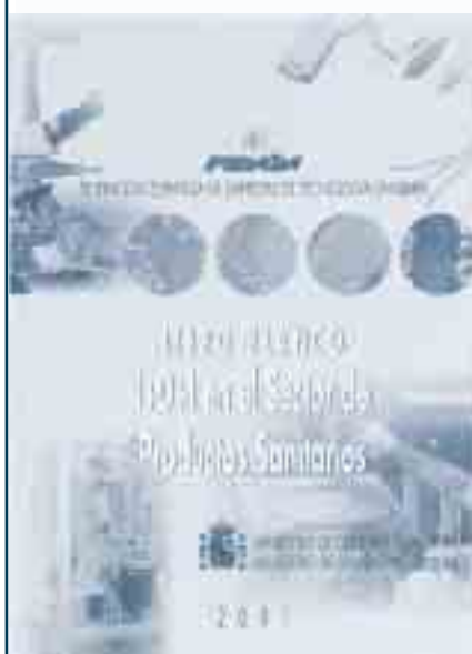
Libro Verde y Blanco de la I+D+i en el Sector de Productos Sanitarios (2001).