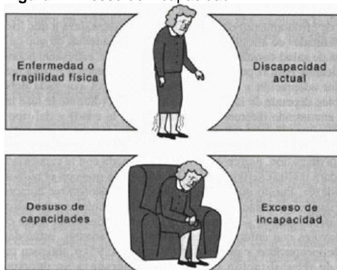
Figura 2. Exceso de incapacidad*

Así, el exceso de incapacidad se refiere al deterioro provocado por el desuso de capacidades preservadas que no son consecuencia directa de un estado de fragilidad física o enfermedad y que son de carácter reversible. El exceso de incapacidad significa atribuir a la enfermedad los comportamientos de dependencia cuando de hecho se derivan también de otra fuente más benigna que sí es reversible (efectos secundarios, alteraciones de conducta, ambiente físico inadecuado, contingencias ambientales favorecedoras de dependencia o estereotipos y atribuciones negativas hacia las personas mayores). En definitiva, una persona con exceso de discapacidad es aquella que está más deteriorada de lo que debería (ver figura 2).